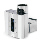
Modello Elettrico Electric Model

Ordering example: 73000100050 44 = mod. Rubin, height 1000 mm x width 500 mm, color Ral 9016.