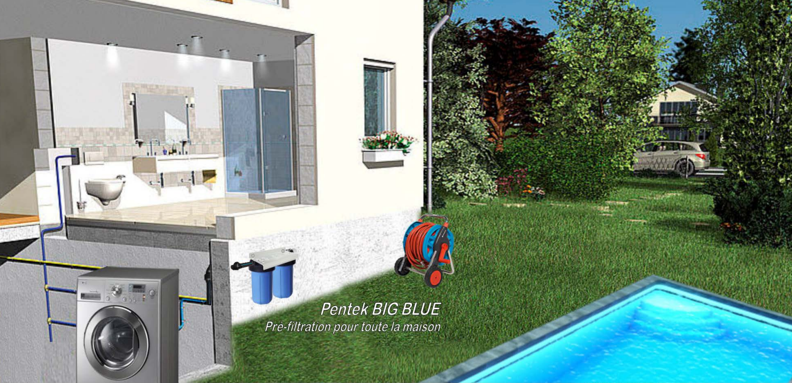
Pentek BIG BLUE Pré-filtration pour toute la maison