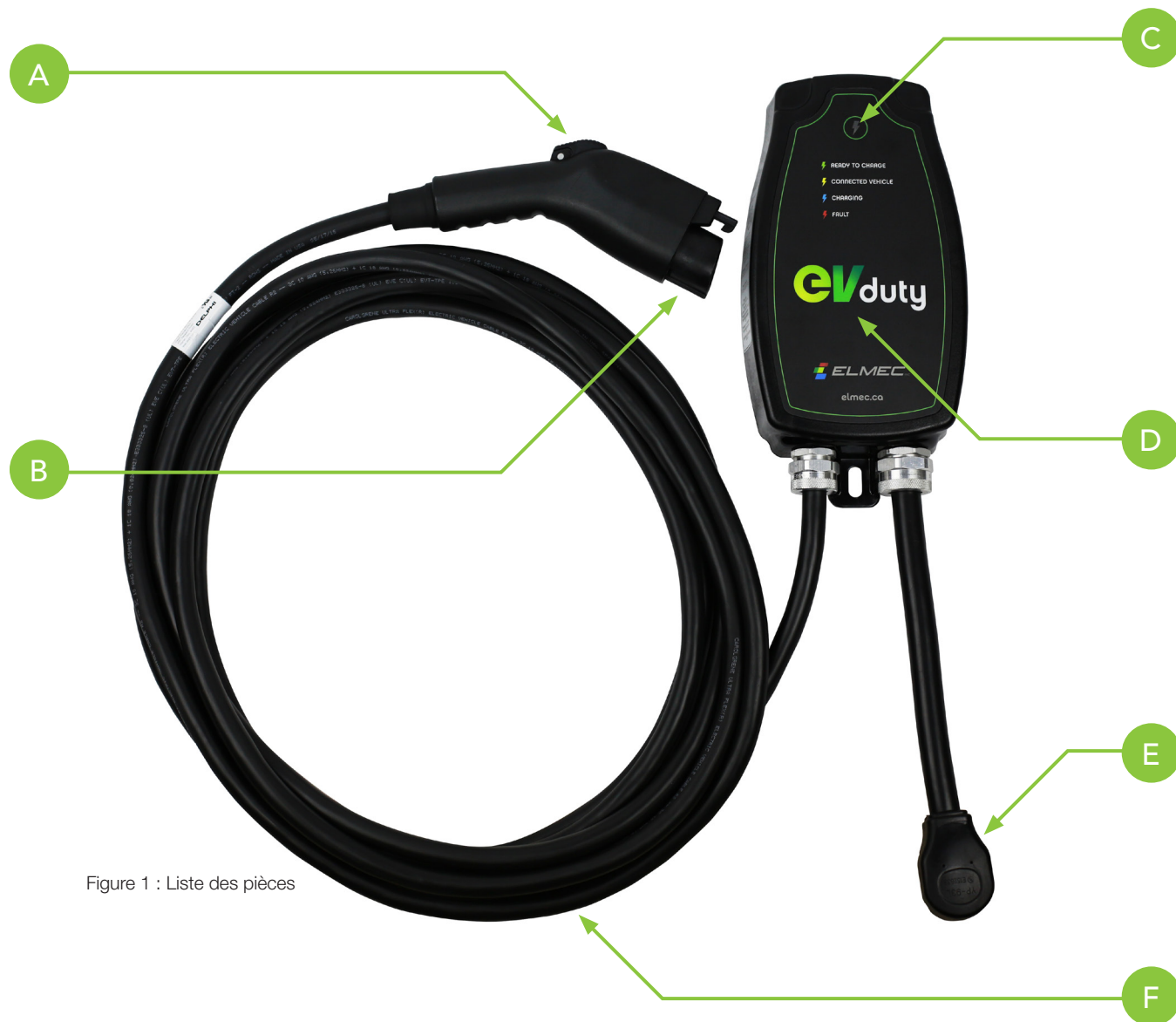
Figure 1 : Liste des pièces

Voici une description des pièces principales de cet équipement :