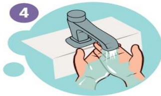
4 Hände gut spülen