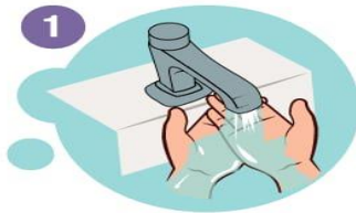
1 Hände mit Wasser benetzen

Händewaschen sollte rund 20 bis 30 Sekunden dauern. Für möglichst keimfreie Hände sollten diese mit Seife (am besten Flüssigseife) gewaschen werden.