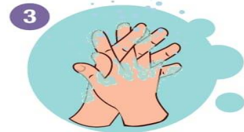
3 Hände reiben, inkl. Handrücken, Finger und Handgelenke