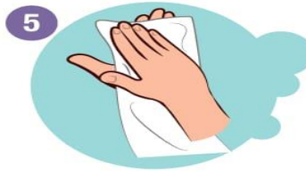
5 Mit Einweghandtuch trocknen