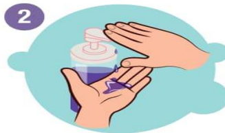
2 Gründlich einseifen