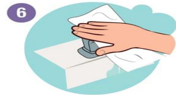
6 Wasserhahn mit Einweghandtuch schliessen