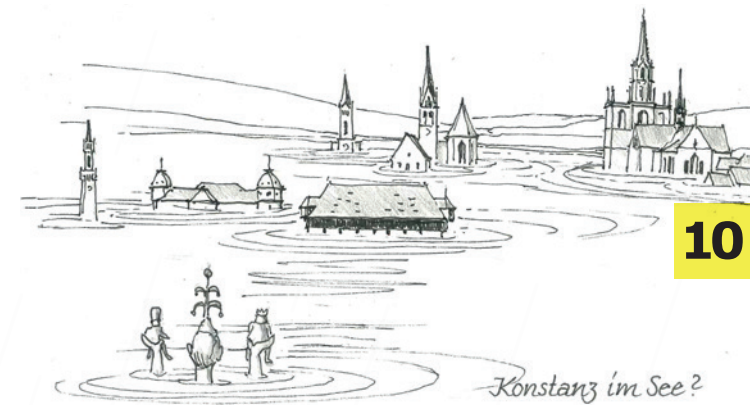
Konstanz im See? Zeichnung: Manfred Heier