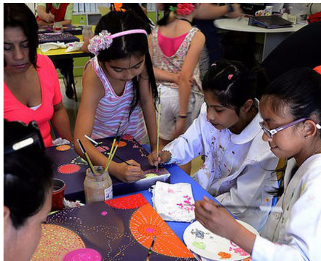
Taller de Arte Teletón Santiago

El enfoque en estas habilidades de la persona, es pertinente en el contexto de la rehabilitación física, porque son pilares que sostienen un autoconcepto positivo en los pacientes, ergo, facilitan los procesos de inclusión del paciente hacia la comunidad, al reforzar su auto-afirmación, primero dentro del contexto Teletón y luego dentro de la escena social próxima.