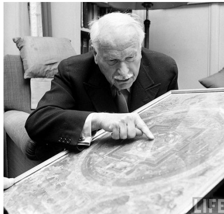
Carl G. Jung.

El arte en sus variadas formas estuvo siempre presente en la vida de Carl G. Jung. En sus memorias y escritos encontramos diversas referencias al papel que tuvo la expresión artística visual, tanto en su vida personal, ayudándole a ordenar sus ideas, así como en la profesional con sus pacientes. El valor otorgado a las imágenes