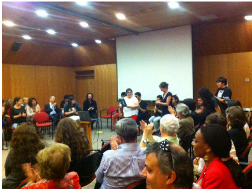
Lanzamiento del libro

De sus integrantes surge la idea de hacer un libro, con el criterio editorial de que todas las voces caben, respetamos la espontaneidad de los textos, entonces no arreglamos la redacción. Nos importa lograr ponerle palabras a lo que se está viviendo, a veces surgen sensaciones, emociones o historias difíciles de contar y cuando estas verdades emergen en el grupo se produce la belleza.