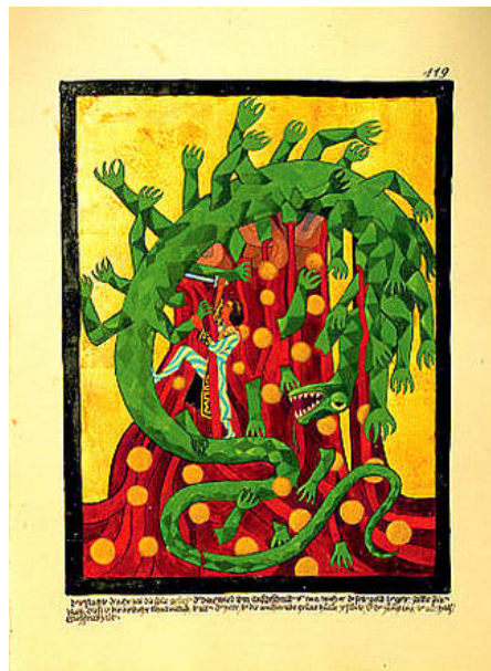
Imagen del libro Rojo, C. G. Jung

El arte terapia desde esta mirada parte de la base de que el ser humano, tenga o no una formación artística, posee la capacidad latente para proyectar tanto sus conflictos interiores, así como las soluciones creativas de los mismos, de una forma visual, reconociendo que los sentimientos y pensamientos más esenciales, derivados del inconsciente, alcanzan expresión más fácilmente a través de imágenes y no de palabras, ya que muchas veces, estas resultan inadecuadas o insuficientes.