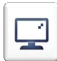
Pantalla full color TFT