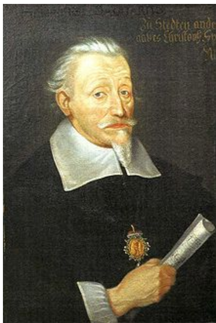
Heinrich Schütz (1585 - 1672)

à Dresde avec ce nouveau style italien. Il l'adapte à la langue allemande. Le mariage des deux est une réussite. La musique qui en résulte est riche en émotion, elle est toujours au service du texte biblique, qu'elle suit au plus près.