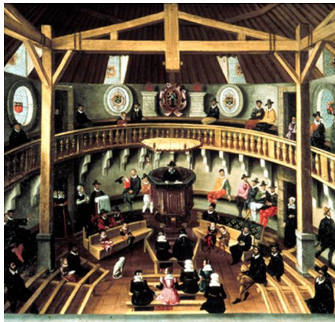
Temple du Paradis, XVI e siècle - Les protestants français chantent uniquement les Psaumes

Dans les cultes, le chant devient la participation principale de l'assemblée. Au cours du XVI e siècle, un corpus de cantiques protestants se constitue. Les compositeurs les mettent en musique selon les formes musicales en usage en leur temps. C'est ce que fait Claude Goudimel en France pour le Psautier réformé. Les cantiques et les psaumes sont donc mis en polyphonie. On peut y ajouter des instruments qui doublent les voix.