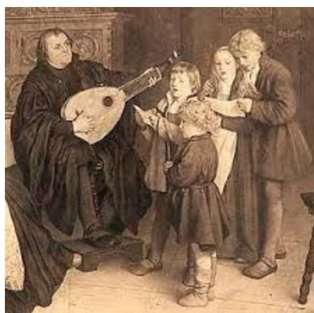
Martin Luther - gravure du XIXe siècle

Martin Luther aime la musique. Théologiquement, il la considère comme un don de Dieu. Ce don doit être utilisé, notamment pour louer Dieu en retour. Dans la Préface à un recueil de cantiques, Luther fait l'éloge de Dame Musique (Fraw Musica). Il aime le chant des oiseaux. Il joue lui-même du luth et chante volontiers.