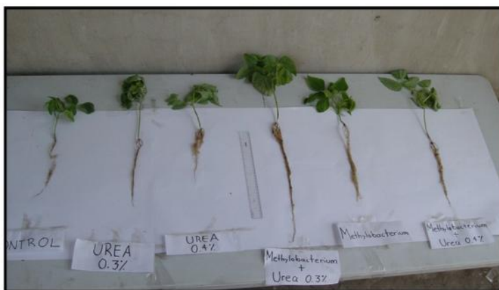
Fig. 1. Diferencia en el desarrollo vegetal y el desarrollo de la raíz entre los diferentes tratamientos.

La concentración de aminoácidos libres en las hojas se incrementaron por la fertilización foliar con urea en inoculación de M. extorquens , que corresponde a los tratamientos MU3 y MU (Fig. 2) en comparación con los tratamientos donde se fertilizo de manera foliar urea e inculo M. extorquens de manera individual U3, U4, M y con el testigo absoluto C . Las altas concentraciones de proteína en las hojas fertilizadas vía foliar e inoculadas con M. extorquens respecto a las fertilizadas de manera individual con urea representan una evidencia de un abasto suficiente de nitrógeno a la planta por parte de M. extorquens , el cual es logrado en este caso exclusivamente.