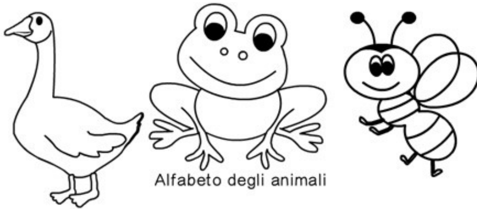
Alfabeto degli animali

A è l'ape che ronza sul fiore B è la balena, blu di colore, C è la capra che bruca l' erbetta, D è la donnola che la preda aspetta. E è l'elefante con il suo nasone, F è la foca che sta sul pallone. G è la gatta che le fusa ti fa, H senza animali sola se ne sta, ma guarda e sorride a chi invece ne ha. I è l'ippopotamo che il bagno si fa, L è la lepre che salta qua e là . M è la mosca dai piedi pelosi, N è il narvalo tra i grossi marosi. O è l'oca che passeggia in giardino, P è il passerotto dal canto argentino. Q è la quaglia con la sua covata, R è la rana dall' acqua bagnata. S è il salmone che va contro corrente, T è la trota dentro il torrente. U è l'usignolo che si liscia le piume, V è la volpe che pesca pesci nel fiume. Z è la zebra che ti viene a dire: Questa filastrocca ora deve finire!!