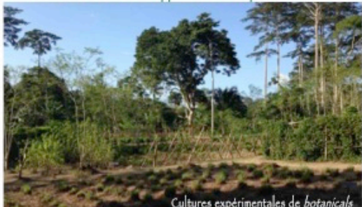
Cultures expérimentales de botaniques

Merci de soutenir le développement d'entreprises locales de calibre international