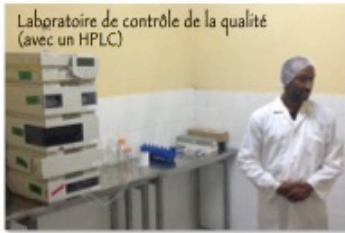
Laboratoire de contrôle de la qualité (avec un HPLC)

Merci de soutenir le développement d'une filière économique d'exportation durable