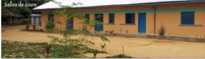
Salles de cours