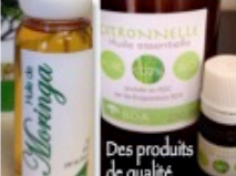
Des produits de qualité