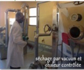
séchage par vacuum et chaleur contrôlée