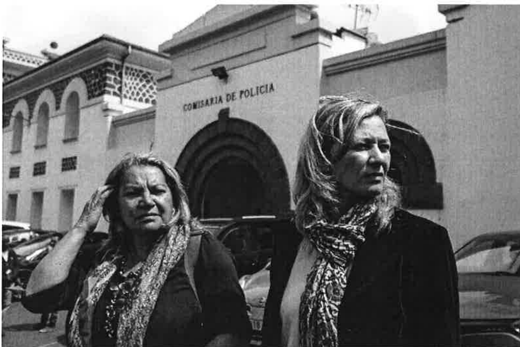
Las diputadas de Podemos por la provincia de Las Palmas, Victoria Rosell (d) y Meri Pita (i), anteayer a su salida del CIE de Barranco Seco (Gran Canaria).

La diputada de Podemos negó entonces esas acusaciones. Victoria Rosell aseguró que entregó el pendrive en julio de 2014, y que fue entonces cuando pidió que se trasladara a las partes. Para acreditar su versión, exhibió en la cuenta de Twitter de Podemos un escrito, aparentemente tomado del sumario, en el que consta que recepción ese dispositivo electrónico y que dio orden de que se diera traslado