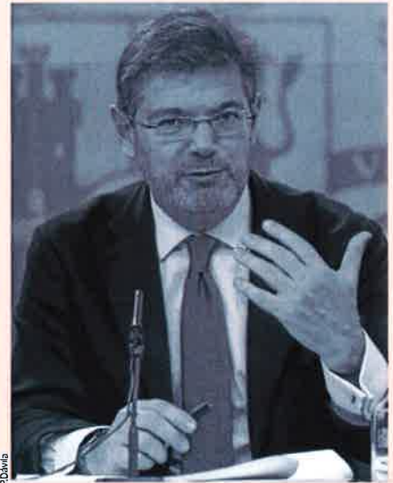
Rafael Catalá, repite como ministro de Justicia.

revisión del Código Penal. Catalá, licenciado en Derecho por la Universidad Complutense de Madrid, ha ocupado distintos cargos en la Administración General del Estado junto a Mariano Rajoy. Fue director general de la Función Pública cuando el ahora presidente ocupaba la cartera de Administraciones Públicas, entre 1996 y 1999. Después, se marchó al Ministerio de Educación, Cultura y Deporte, donde trabajó hasta el año 2000. También hay que destacar que antes de ser nombrado ministro de Justicia, ocupaba el cargo de secretario de Estado de Infraestructuras, Transportes y Vivienda en el Ministerio de Fomento, que dirigía la actual presidenta del Congreso, Ana Pastor.