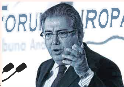
El nuevo ministro de Interior, Juan Ignacio Zoido.