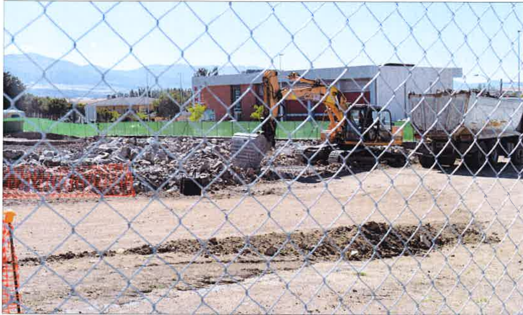
Los trabajos de preparación del terreno han comenzado hace ya algunos días en la parcela.