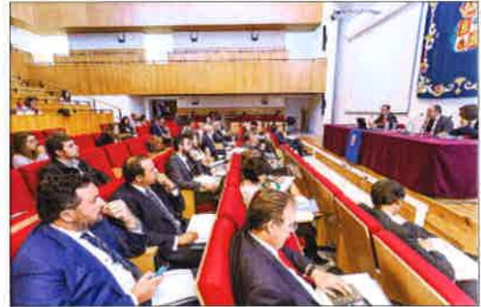
Las Jornadas de Derecho Concursal se celebran en Derecho.