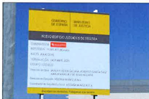
El cartel anunciador de la obra ya luce en la parcela.

Con esta primera fase, Segovia concentrará los diez juzgados diseminados por la ciudad (los seis de primera instancia e instrucción, el de lo Penal, el de lo Social, el de lo Contencioso-Administrativo y el de Menores), y dispondrá