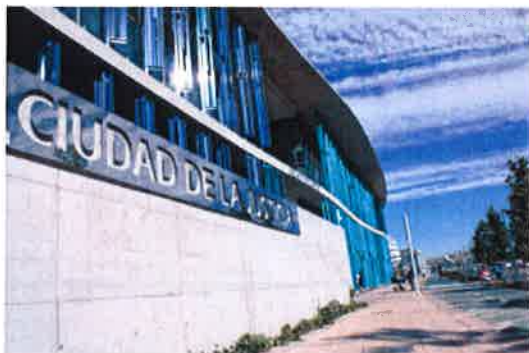
En la actualidad en Aragón funciona el sistema LexNet