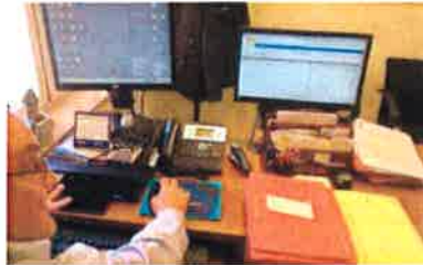
El secretario del Juzgado de Menores usa la firma digital.

SUSANA ARIZAGA La desaparición del expediente judicial de papel va tomando forma con la apertura de más de 50.000 demandas civiles, contenciosas y laborales desde enero hasta hoy con el programa Minerva Digital; y la realización de 150.936 notificaciones entre los órganos judiciales de la provincia y entre estos y los profesionales del Derecho en el mismo periodo online, a través de la plataforma de Internet Lexnet.