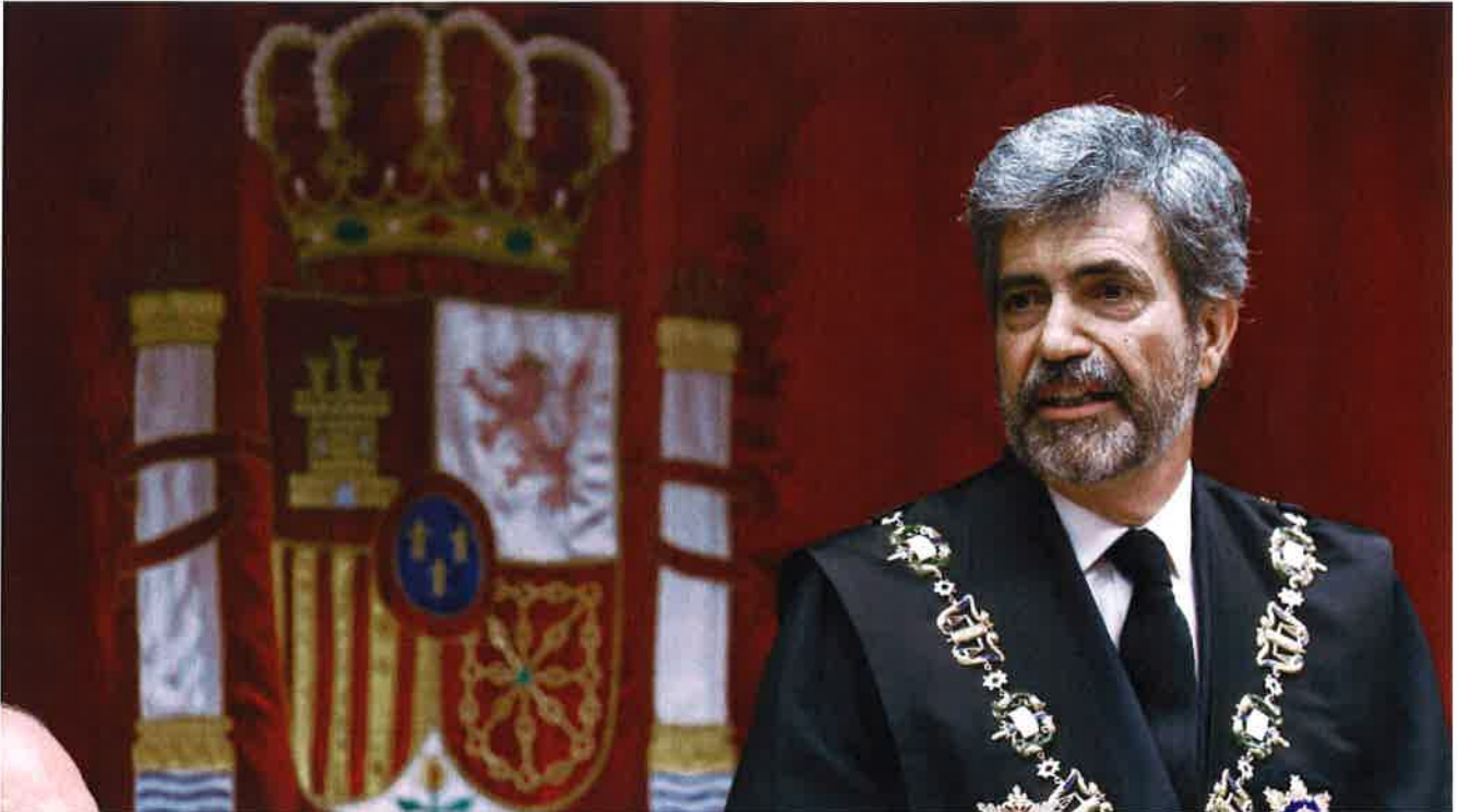
Carlos Lesmes E. E.

Con motivo del I Aniversario de EL ESPAÑOL, este diario organiza esta semana una serie de coloquios que contarán con los principales actores políticos y sociales como protagonistas: de la reforma de las pensiones a la de la Justicia, pasando por la laboral o la de las políticas de empleo.