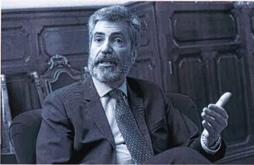
Carlos Lesmes, presidente del Consejo General del Poder Judicial y del Tribunal Supremo.

¿Sería ésta la solución definitiva? No lo cree así el presidente del CGPJ, Carlos Lesmes, que en una reciente entrevista con este diario señalaba que la elección estrictamente corporativa de los vocales también entraña riesgos, como que "se administre el Consejo en beneficio de la corporación profesional y no tanto de la sociedad entera". Lesmes aboga por "un modelo consensuado que pacifique la cuestión políticamente", y recuerda que PSOE o Podemos no están de acuerdo con la elección corporativa. Pero, en todo caso, rechaza de plano la asociación entre el modo de elección de los vocales y la presunta politización de la Justicia.