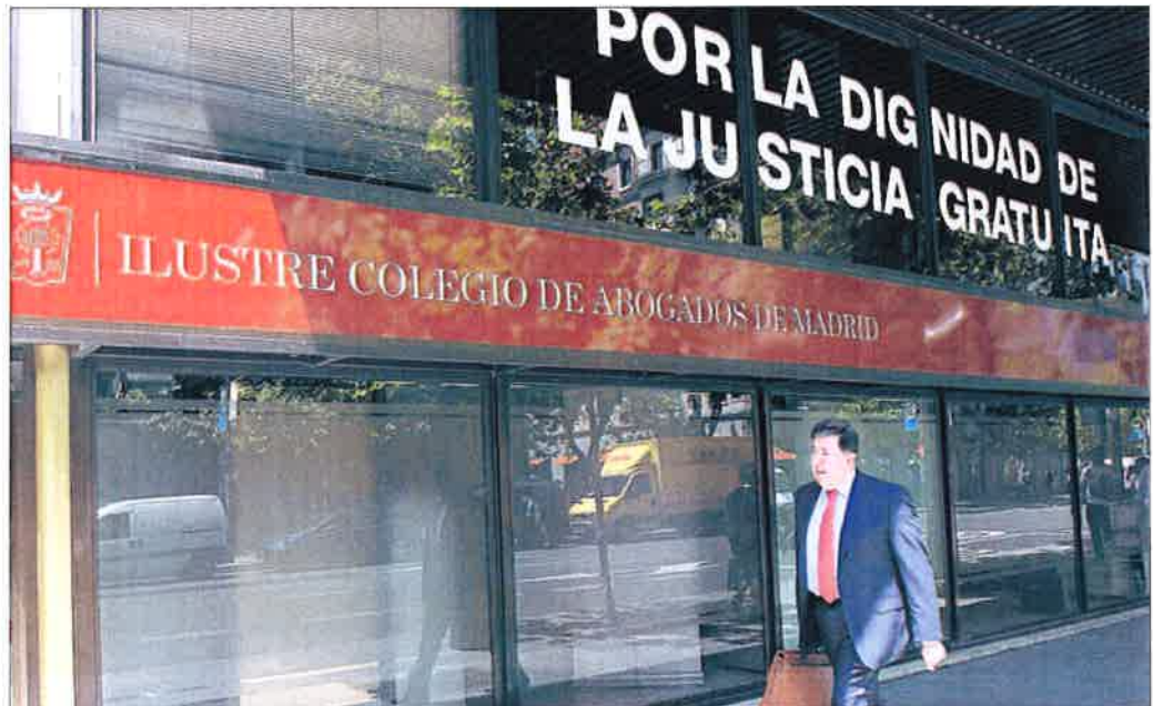
Sede del Colegio de Abogados de la capital. PABLO MONGE

El PP, que fracasó en su intento de sacar adelante la nueva norma, señaló ante los representantes de los distintos colegios profesionales la necesidad de aprobar una ley que regule este sector, pero admite que a día de hoy no es una prioridad. En referencia a los acuerdos internacionales, el partido más votado en las elecciones del 20 de diciembre concede especial relevancia a la homologación de los títulos, la garantía de la formación y la posibilidad de trabajar fuera de España.