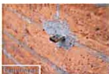
'Dead Drops': mapa de los miles de USB escondidos por el mundo (MediaTrends)