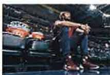
Playoffs NBA: Repudiado por sus fans: los hinchas de los Cavs recaudan para... (Marca)