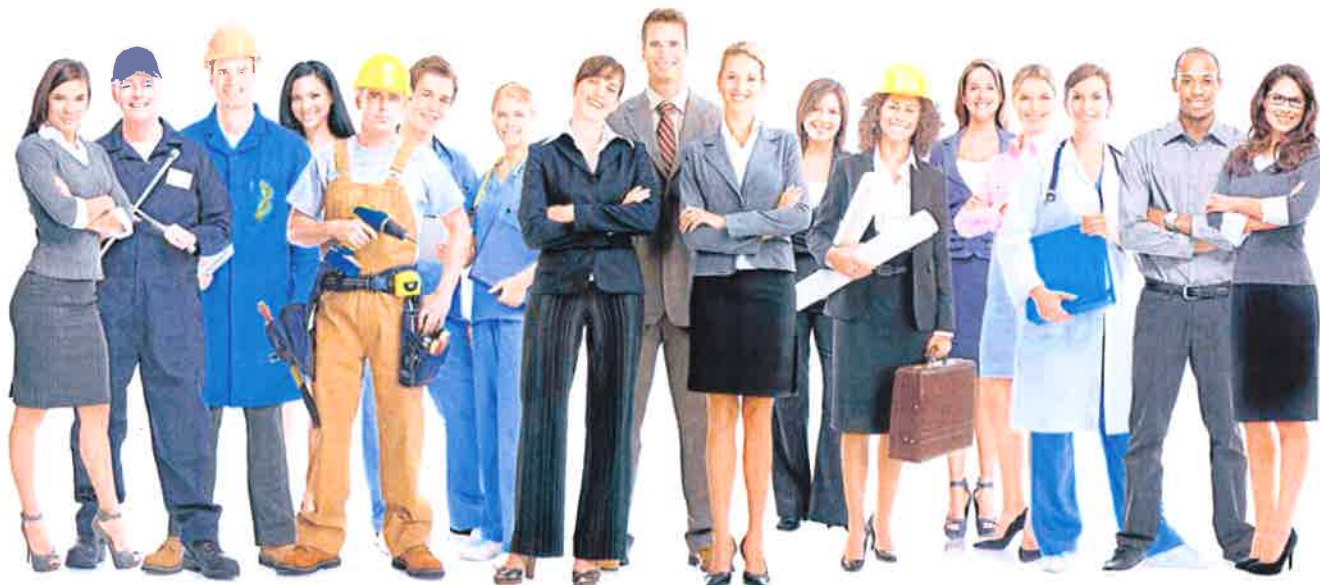
Un grupo de personas, representando a los numerosos oficios que combaten en los mercados. LV

FORMACIÓN Subsisten por las cuotas de sus miembros, que representan el 9% del PIB y el 6% del empleo