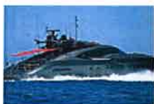
Dentro del yate donde Cristiano Ronaldo disfrutó de Ibiza; se alquila por... (Expansión)