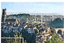
Friburgo está considerado uno de los complejos medievales más... (My Switzerland)