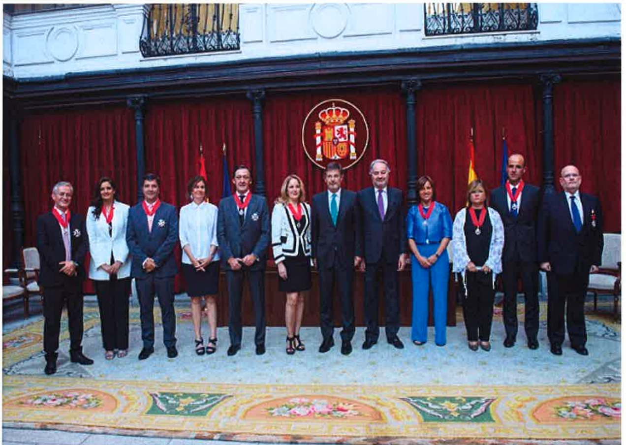
Rafael Catalá premia el trabajo de los procuradores con la Orden de San Raimundo de Peñafort