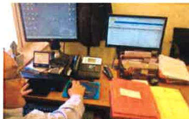
El secretario del Juzgado de Menores usa la firma digital.

SUSANA ARIZAGA La desaparición del expediente judicial de papel va tomando forma con la apertura de más de 50.000 demandas civiles, contenciosas y laborales desde enero hasta hoy con el programa Minerva Digital; y la realización de 150.936 notificaciones entre los órganos judiciales de la provincia y entre estos y los profesionales del Derecho en el mismo periodo online, a través de la plataforma de Internet Lexnet.