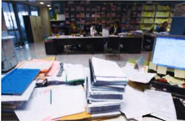
Imagen de un juzgado ubicado en la Ciudad de