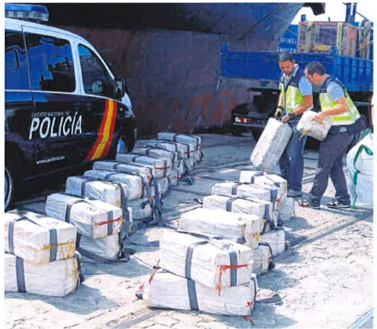
Fardos de cocaína interceptados durante una operación reciente

En estos momentos, el servicio de decomiso de la FGcN gestiona ocho turismos, una motocicleta, un trailer y diversos equipos de climatización incautados en operaciones contra el tráfico de drogas. ■