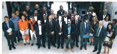
Alcaldes, jueces, abogados, procuradores y otras autoridades, ayer en Belanzos tras firmar el acuerdo. la opinión

El concello realizará un seguimiento de una víctima de violencia de género después de que el juez le otorgue una orden de protección y avisará si hay alguna emergencia o realizará informes psicológicos y sociales sobre menores en situación vulnerable o sobre personas sometidas a internamiento. Ésta es una de las actuaciones a las que se comprometen los concellos del partido judicial de Belanzos para mejorar la eficacia y rapidez de la justicia, fundamentalmente en temas relacionados con los servicios sociales. Ayer se firmó la creación de una Comisión de Justicia del Partido Judicial de Belanzos en la que participan los 16 ayuntamientos del partido judicial, el Consorcio AS Mariñas, los juzgados brigantinos, y los colegios de abogados y procuradores.