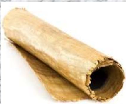
Rollo de Papiro

Así que el término válido, cierto y correcto que debe usarse es Sagradas Escrituras, que es uno de los términos que efectivamente si aparece utilizado, no como la palabra “biblia” que no aparece en ninguno de sus libros, y nunca ni los hijos de Israel ni los creyentes antiguos la conocieron por ese nombre. 2 Timoteo 2/14-16: “Pero persiste tú en lo que has aprendido y te persuadiste, sabiendo de quién has aprendido; y que desde la niñez has sabido las Sagradas Escrituras, las cuales te pueden hacer sabio para la salvación por la fe que es en el Mesías Jesús. Toda la Escritura es inspirada por Dios, y útil para enseñar, para redargüir, para corregir, para instruir en justicia, a fin de que el hombre de Dios sea perfecto, enteramente preparado para toda buena obra.”