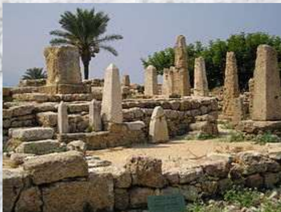
Ruinas del Antiguo Puerto de Biblos

La palabra “biblia” proviene de la palabra latinizada “biblia”, que viene a su vez de la palabra griega “ biblion ”, que se traduce como libro, cuyo plural era “biblia” traducido como libros. Y los griegos a su vez tomaron la palabra “ biblion ” de un famoso puerto fenicio de la antigüedad conocido como Biblos, ya que desde ese puerto se comercializaba el papiro traído de Egipto, material este con el que se hacían los rollos o libros en los cuales se escribía en la antigüedad y con ese nombre de “biblos” se identifico en el transcurso del tiempo a esos rollos de papiro egipcio.