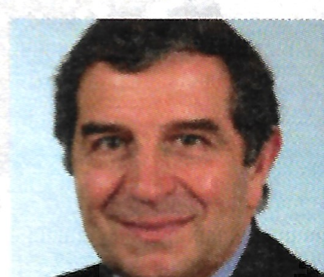
Guy Malherbe Député de la 4 ème circonscription de 2007 à 2012. Maire d'Épinay sur Orge de juin 1995 à novembre 2017.