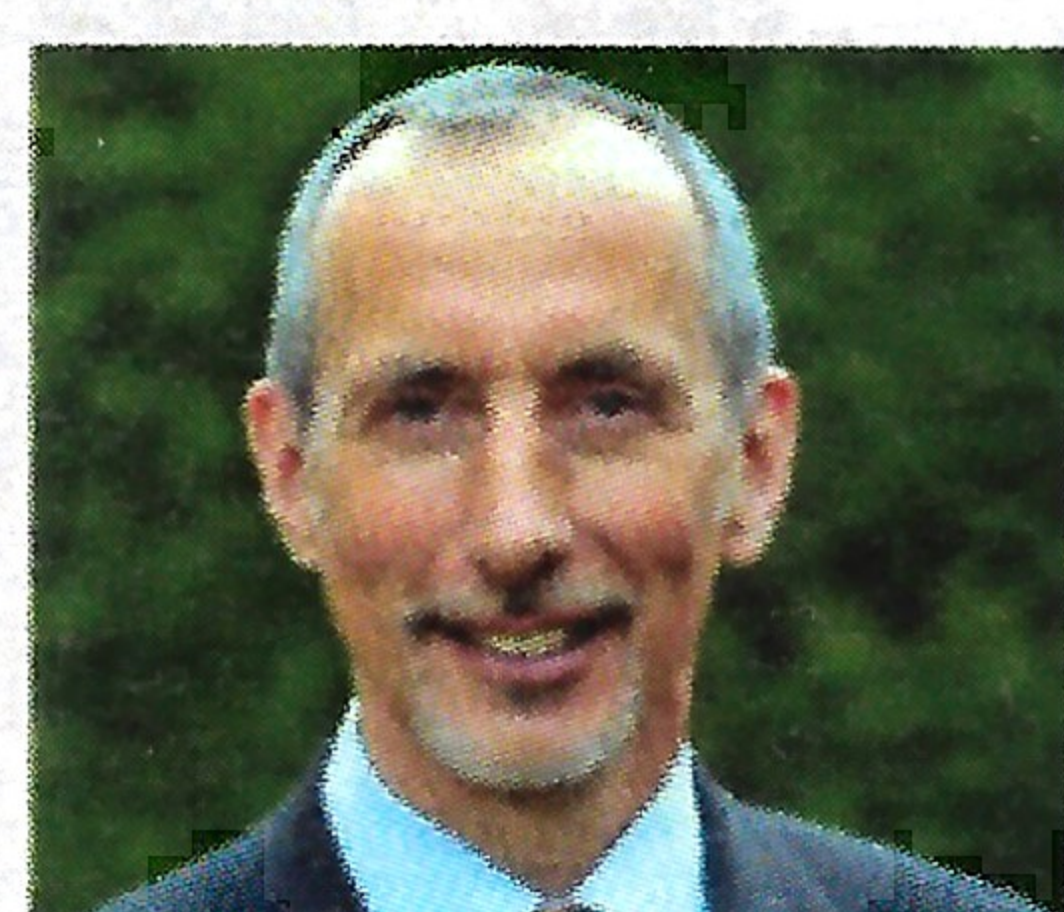
Jean-Raymond Hugonet Sénateur de l'Essonne.