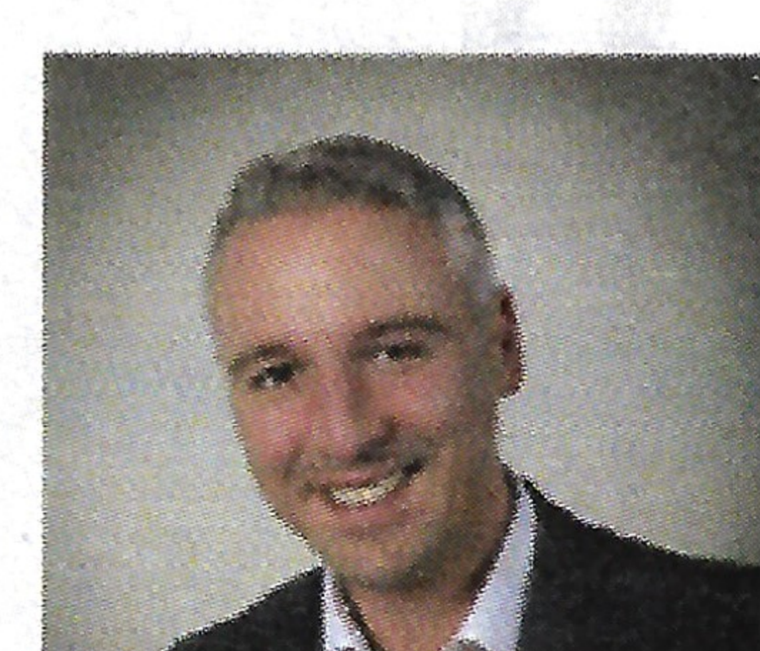
Stéphane Bazile Maire de Saulx les Chartreux.