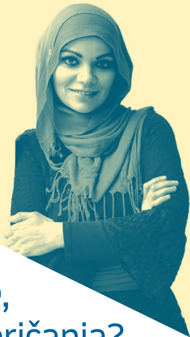
Fajla Pašić Bišić, častna ambasadorica medkulturnega dialoga