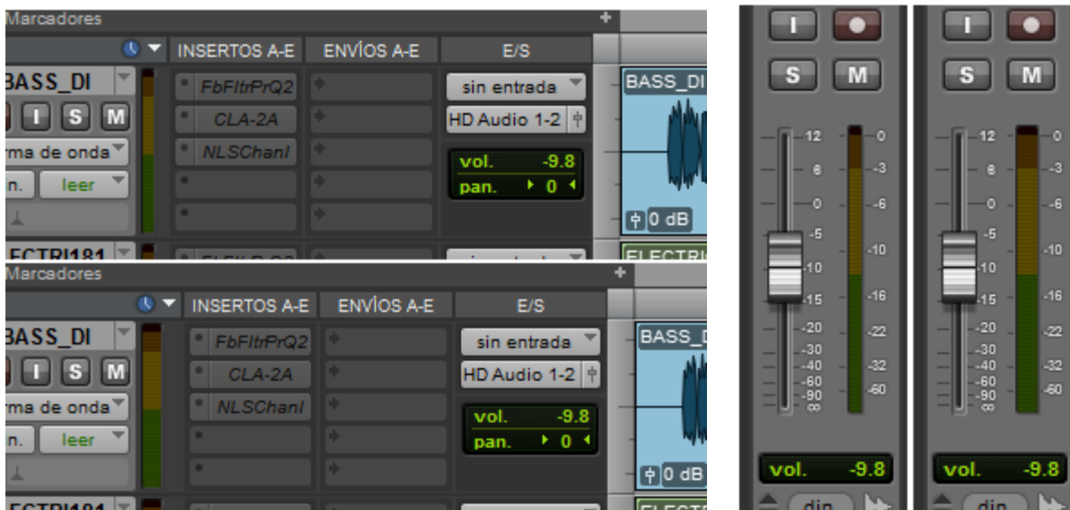
Vistas con y sin engordar el medidor, Ventana Edit y Ventana Mix.

Cmd+Opt+Ctrl+ Clic sobre el medidor : Este es un “truco” poco conocido (cuyo uso puede ser muy útil) que hace que los medidores de nivel se hagan más visibles en ambas ventanas (Mix y Edit).