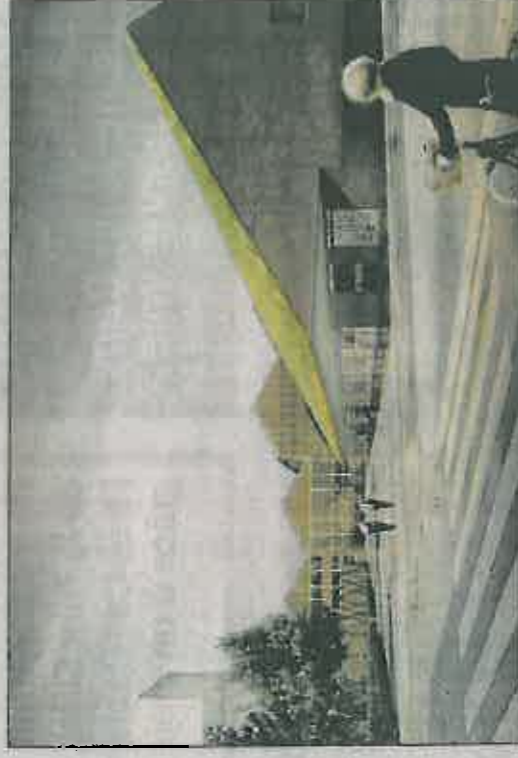
En 2016, un lycée hôtelier ouvrira ses portes sur le site. À la fin du projet, en 2023, ce nouveau quartier abritera 1 200 logements.