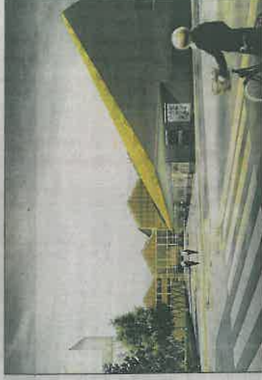
En 2016, un lycée hôtelier ouvrira ses portes sur le site. À la fin du projet, en 2023, ce nouveau quartier abritera 1 200 logements.

Après un long sommeil, cet immense château rouillé de Belle au bois dormant va connaître une nouvelle vie. Déjà, l'ancien bâtiment de la direction accueille la bourse du travail. D'ici deux ans, un lycée hôtelier suivra. Les premiers logements arriveront, eux, en 2017. Le projet de l'urbaniste Djamel Klouche est d'atteindre 1 200 logements à la fin de la métamorphose. Soit en 2023. À ce moment-là, cette ville dans la ville aura été reconnectée au reste du tissu urbain local. Grâce, notamment, à un parc, une piscine ou encore une salle de sport. ■