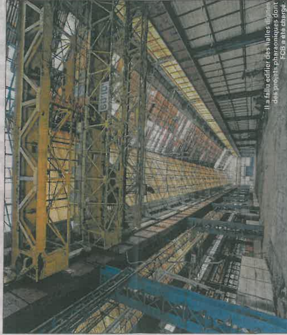
Il a fallu édifier des valles dignes des projets pharaoniques dont FCB a été chargée.

Qui, aujourd'hui, ignore encore que l'ancienne usine métallurgique Fives Cail Babcock va connaître une nouvelle vie ? En 2023, les 16 hectares du site bourdonneront de nouveau grâce à des logements ou des centres de formation. Pour sentir le pouls de ce monument, toujours si présent seize ans après sa fermeture, il est vital d'arpenter cette ville dans la ville, avant la métamorphose à laquelle elle est promise.