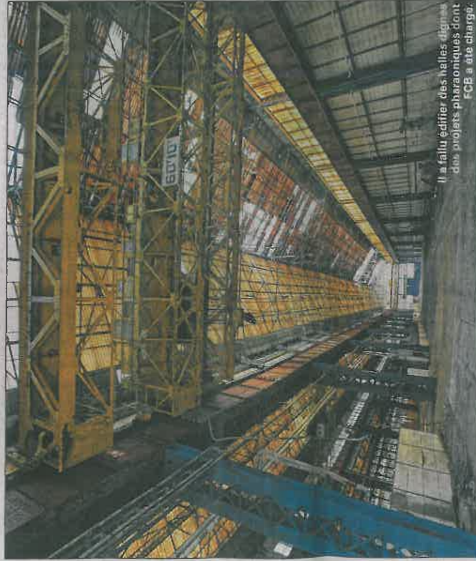
Il a fallu édifier des halles dignes des projets pharaoniques dont FCB a été chargé.