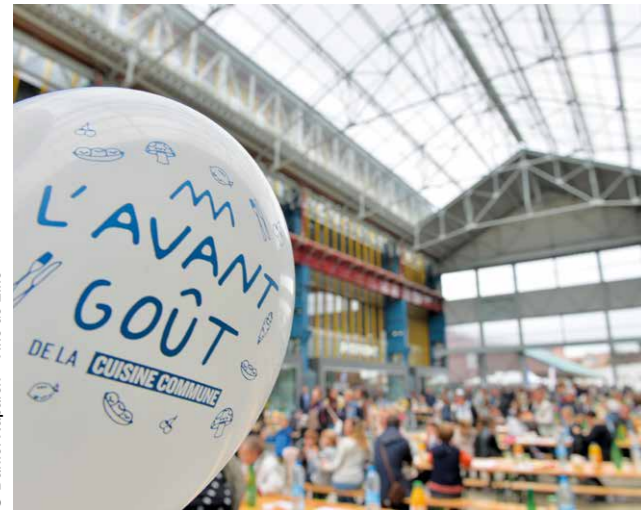
© Daniël Rapach - Ville de Lille