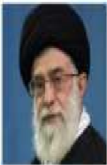
עלי חמנאי המנהיג העליון

'לא חשוב מה שאתה זורק כאשר אתה זורק, אלוהים הוא הזורק'". אשר לפוליטיקה פנימית התבטא סולימני בחריפות בהתייחסו לביקורת על משמרות המהפכה, ובעקיפין התייחס לנשיא חסן רוחני "ברפובליקה האסלאמית, כולנו אחראים לחללינו, לחברה, לדת ולמדינה. הבגידה הגדולה ביותר היא התכנסות של ספקות על בסיסי המערכת הזו... שום יום לא צריך להחליש את הכוח". זו כנראה התייחסות לביקורת שמתח רוחאני לאחרונה נגד משמרות המהפכה במהלך מסע הבחירות לנשיאות. "אל תשוו את הכוח איתי... הציבו אותי כמטרה לא את הכוח... ללא הכוח לא תהייה מדינה" הוא אמר. סולימני אישר את הירידה בשמירת הדת באירן, הוא האשים בכל את מדיניות המשטר לקידומה של תפיסת הדת שלו "אסור לנו לגרום לאנשים לרחוש פסימיות כלפי הדת ולהפחיד את האוכלוסייה מפני המאמינים האדוקים, מאחר שהרחקת אנשים גורמת לשיעור גירושין גבוה, גידול בשחיתות חברתית וירידה בערכים.. כיצד קורה שאחדים מבקשים להפחיד את האוכלוסייה מפני המאמינים הדתיים? אלה אסטרטגיה ומדיניות מוטעים". מפקד משמרות המהפכה הודה בעבר כי רק חמישה אחוזים מכלל המסגדים באירן פעילים ברציפות במהלך השנה.