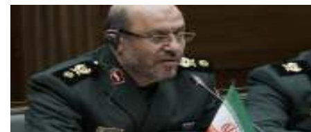
שר ההגנה האיראני – חוסיין דגאהן

צבא ארה"ב האשים את איראן בהחרפת האלימות בעיראק באמצעות מימון האימוץ והציוד של המיליציות. איראן הכחישה והאשימה את ארה"ב כי נוכחות כוחותיה גורמת לאלימות.