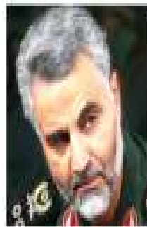
קאסם סולימני מפקד כוח קודס