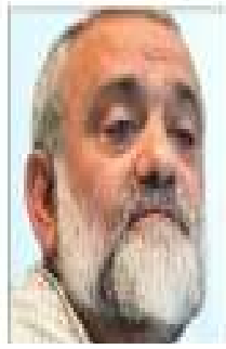
מוחמד רזה נקדי סגן מפקד לענייני תרבות וחברה