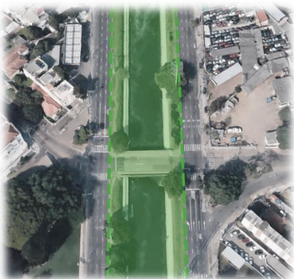
Imagem 01