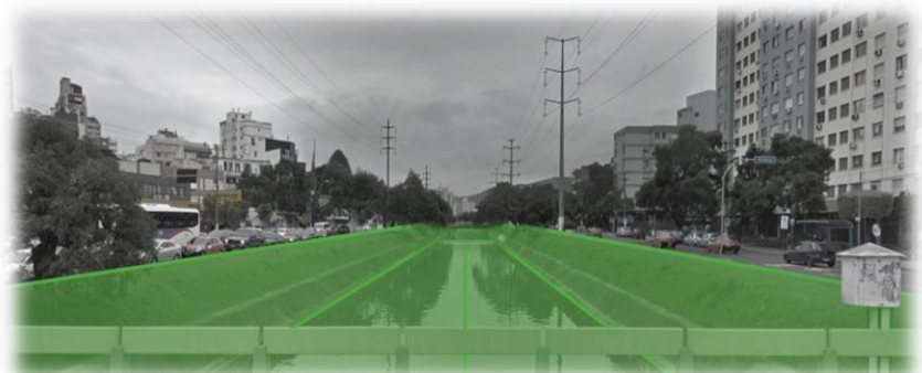
Imagem 02