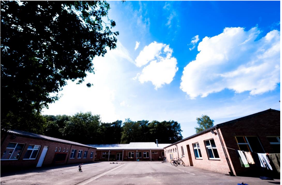
Centrale buitenplein van De Kalei.