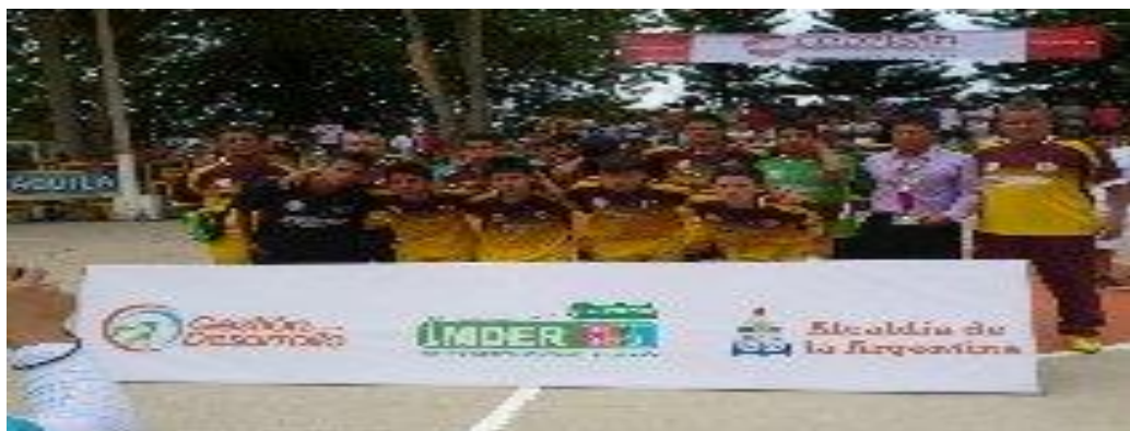
TOLIMA SUB CAMPEON NACIONAL