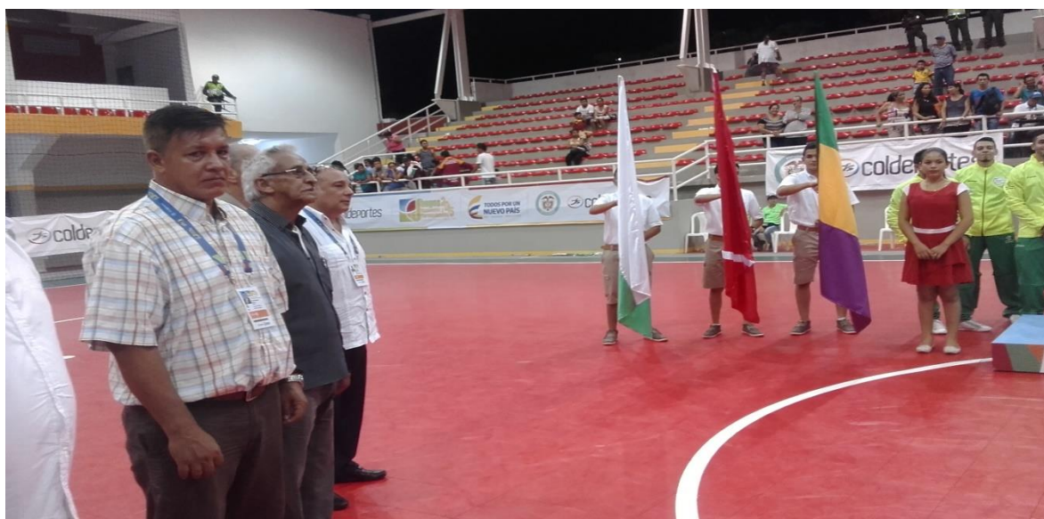
ACTOS PROTOCOLARIOS PREMIACION JUEGOS NACIONALES 2015 COLISEO LA MAGDALENA RAMA MASCULINA

Oficina Coliseo Barrio -Rondón Espinal CEL 3118116188 Tolima sub-campeón nacional femenino 2010 San Antonio Tolima campeón nacional sénior máster 2011 Tolima sub-campeón nacional infantil y juvenil 2012 Tolima MEDALLA DE PLATA juegos nacionales 2012 en femenino TOLIMA SEDE XX JUEGOS NACIONALES ESPINAL Y CHAPARRAL SUB-SEDES Tolima CAMPEÓN NACIONAL escuelas de formación 2015