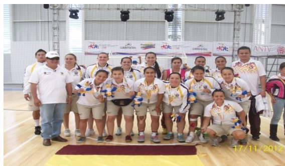
MEDALLA DE PLATA 2012