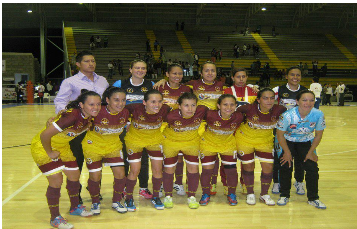
EQUIPO PIJAS TOLIMA

Oficina Coliseo Barrio -Rondón Espinal CEL 3118116188 Tolima sub-campeón nacional femenino 2010 San Antonio Tolima campeón nacional sénior máster 2011 Tolima sub-campeón nacional infantil y juvenil 2012 Tolima MEDALLA DE PLATA juegos nacionales 2012 en femenino TOLIMA SEDE XX JUEGOS NACIONALES ESPINAL Y CHAPARRAL SUB-SEDES Tolima CAMPEÓN NACIONAL escuelas de formación 2015