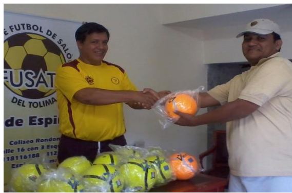
REPRESENTANTE DEL CLUB LICEO DE LOS ANGELES