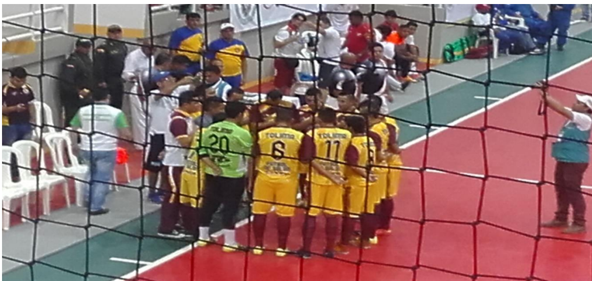
EQUIPO TOLIMENSE JUEGOS NACIONALES 2015 COLISEO LA MAGDALENA RAMA MASCULINA