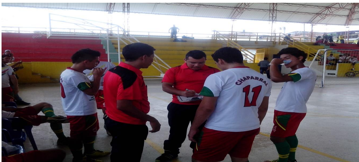
Municipio de chaparral equipo juvenil 2015

Oficina Coliseo Barrio -Rondón Espinal CEL 3118116188 Tolima sub-campeón nacional femenino 2010 San Antonio Tolima campeón nacional sénior máster 2011 Tolima sub-campeón nacional infantil y juvenil 2012 Tolima MEDALLA DE PLATA juegos nacionales 2012 en femenino TOLIMA SEDE XX JUEGOS NACIONALES ESPINAL Y CHAPARRAL SUB-SEDES Tolima CAMPEÓN NACIONAL escuelas de formación 2015