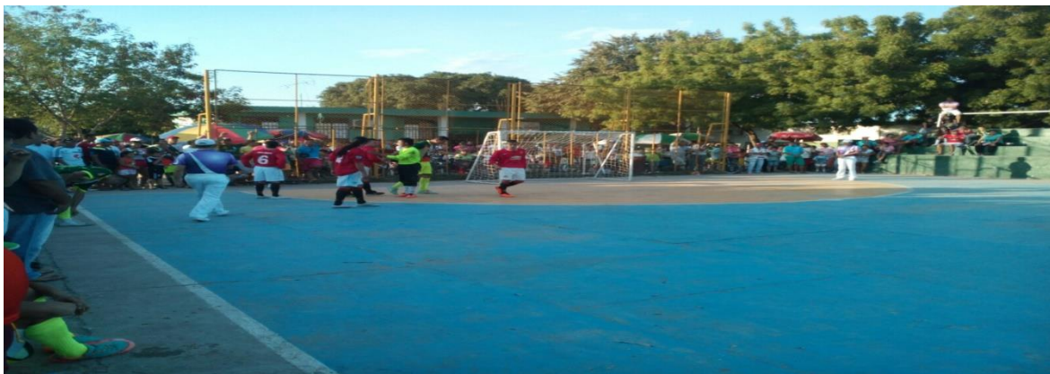
FINAL MILCIUDADES FLANDES 2015 CLUB LICEO LOS ANGELES DE FLANDES Y EL MUNICIPIO DE FRESNO