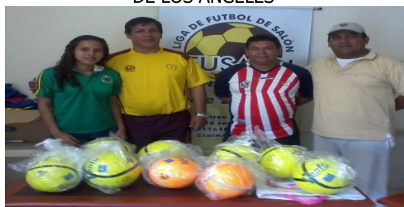
EN LA OFICINA