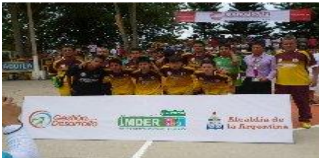
TOLIMA SUB-CAMPEON NACIONAL

Oficina Coliseo Barrio -Rondón Espinal CEL 3118116188 Tolima sub-campeón nacional femenino 2010 San Antonio Tolima campeón nacional sénior máster 2011 Tolima sub-campeón nacional infantil y juvenil 2012 Tolima MEDALLA DE PLATA juegos nacionales 2012 en femenino TOLIMA SEDE XX JUEGOS NACIONALES ESPINAL Y CHAPARRAL SUB-SEDES Tolima CAMPEÓN NACIONAL escuelas de formación 2015