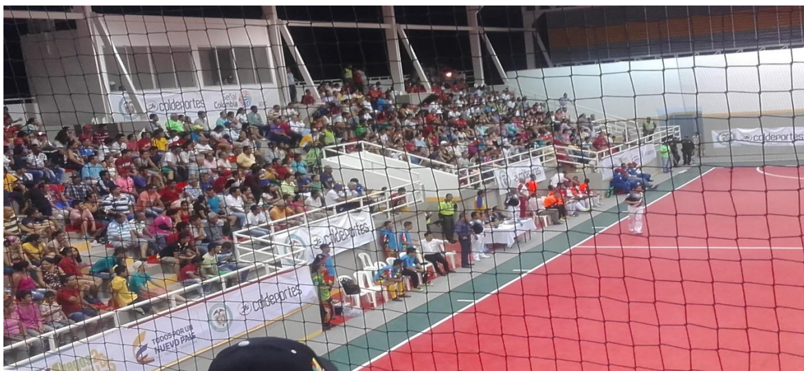
JUEGOS NACIONALES 2015 COLISEO LA MAGDALENA RAMA MASCULINA

Oficina Coliseo Barrio -Rondón Espinal CEL 3118116188 Tolima sub-campeón nacional femenino 2010 San Antonio Tolima campeón nacional sénior máster 2011 Tolima sub-campeón nacional infantil y juvenil 2012 Tolima MEDALLA DE PLATA juegos nacionales 2012 en femenino TOLIMA SEDE XX JUEGOS NACIONALES ESPINAL Y CHAPARRAL SUB-SEDES Tolima CAMPEÓN NACIONAL escuelas de formación 2015