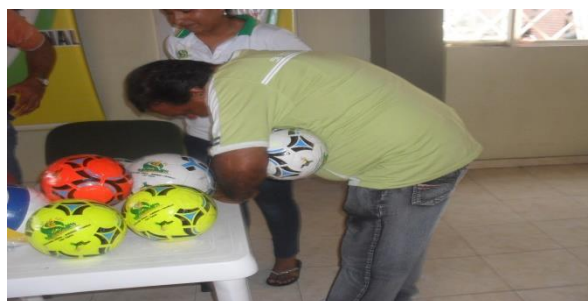
FIRMA DE ESTIMULOS DE LOS PRESIDENTES DE LOS CLUBES

Oficina Coliseo Barrio -Rondón Espinal CEL 3118116188 Tolima sub-campeón nacional femenino 2010 San Antonio Tolima campeón nacional sénior máster 2011 Tolima sub-campeón nacional infantil y juvenil 2012 Tolima MEDALLA DE PLATA juegos nacionales 2012 en femenino TOLIMA SEDE XX JUEGOS NACIONALES ESPINAL Y CHAPARRAL SUB-SEDES Tolima CAMPEÓN NACIONAL escuelas de formación 2015