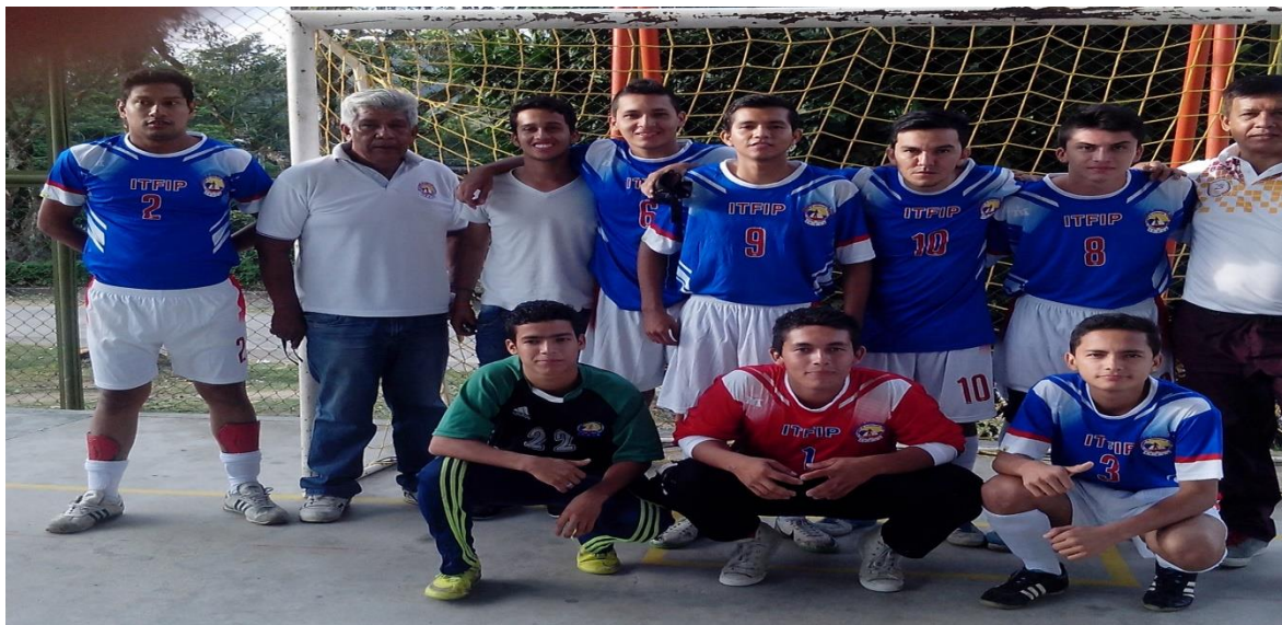
Club ITFIP espinal juvenil 2014