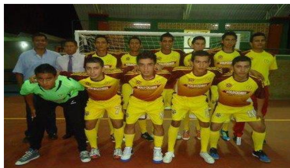
SELECCIÓN MASCULINA JUEGOS NACIONALES

Oficina Coliseo Barrio -Rondón Espinal CEL 3118116188 Tolima sub-campeón nacional femenino 2010 San Antonio Tolima campeón nacional sénior máster 2011 Tolima sub-campeón nacional infantil y juvenil 2012 Tolima MEDALLA DE PLATA juegos nacionales 2012 en femenino TOLIMA SEDE XX JUEGOS NACIONALES ESPINAL Y CHAPARRAL SUB-SEDES Tolima CAMPEÓN NACIONAL escuelas de formación 2015