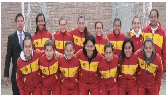
SELECCIÓN FEMENINO JUEGOS NACIONALES