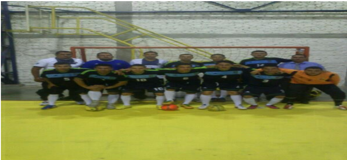
CLUB LICEO LOS ANGELES FLANDES CAMPEON DEPARTAMERNTAL MILCIUDADES 2013- 2014 Y- 2015

Oficina Coliseo Barrio -Rondón Espinal CEL 3118116188 Tolima sub-campeón nacional femenino 2010 San Antonio Tolima campeón nacional sénior máster 2011 Tolima sub-campeón nacional infantil y juvenil 2012 Tolima MEDALLA DE PLATA juegos nacionales 2012 en femenino TOLIMA SEDE XX JUEGOS NACIONALES ESPINAL Y CHAPARRAL SUB-SEDES Tolima CAMPEÓN NACIONAL escuelas de formación 2015