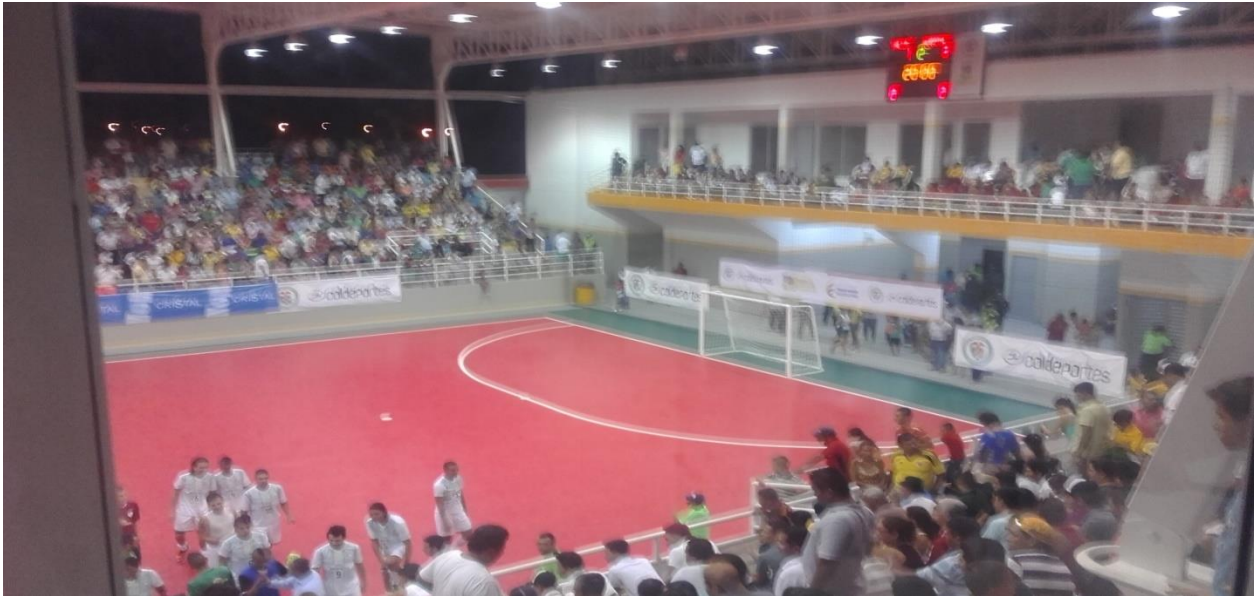
JUEGOS NACIONALES 2015 COLISEO LA MAGDALENA RAMA MASCULINA ZONA VIP