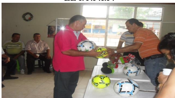
ENTREGA DE ESTIMULOS CLUB ROEST