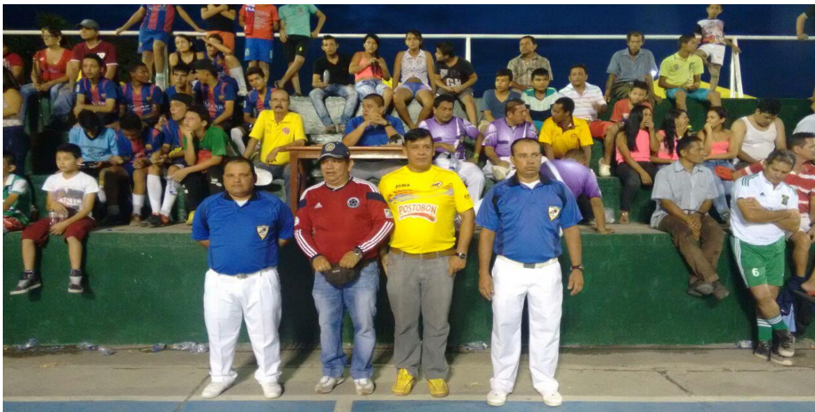
HOMENAJE A LOS JUGADORES SELECCIÓN COLOMBIA CAMPEONES MUNDIALES FLANDES TOLIMA