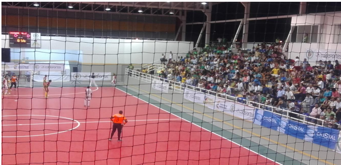
JUEGOS NACIONALES 2015 COLISEO LA MAGDALENA RAMA MASCULINA