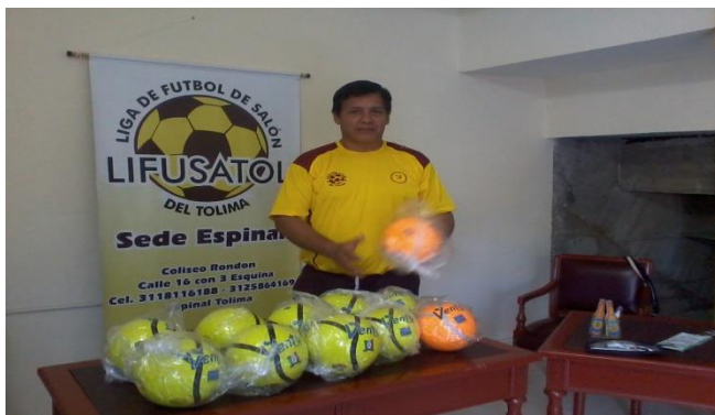
PRESIDENTE DE LA LIGA EN LA OFICINA