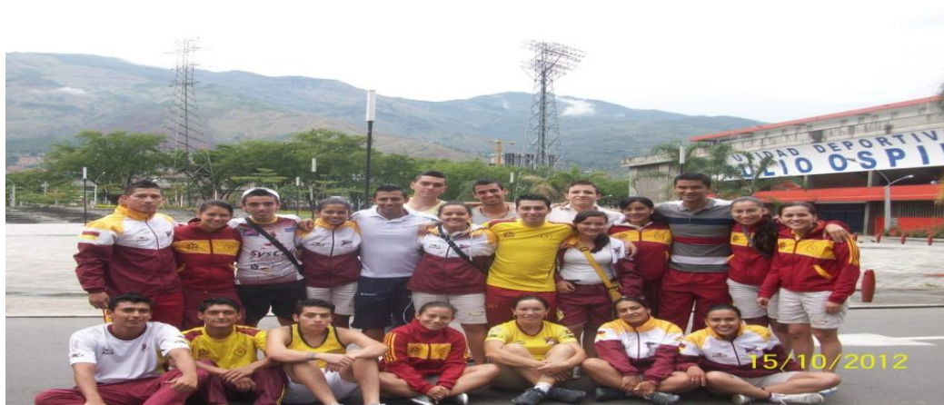
SELECCIÓN TOLIMA JUEGOS NACIONALES 2012