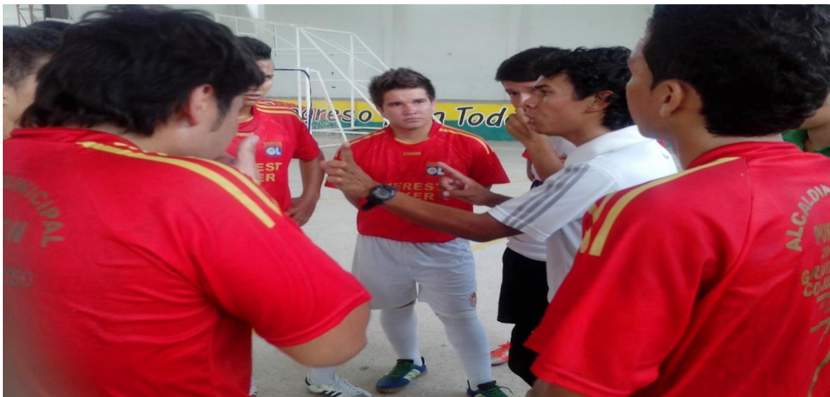
Club los amigos purificación juvenil 2014