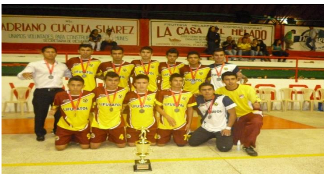
SELECCION SUB 23 BASE A JUEGOS NACIONALES