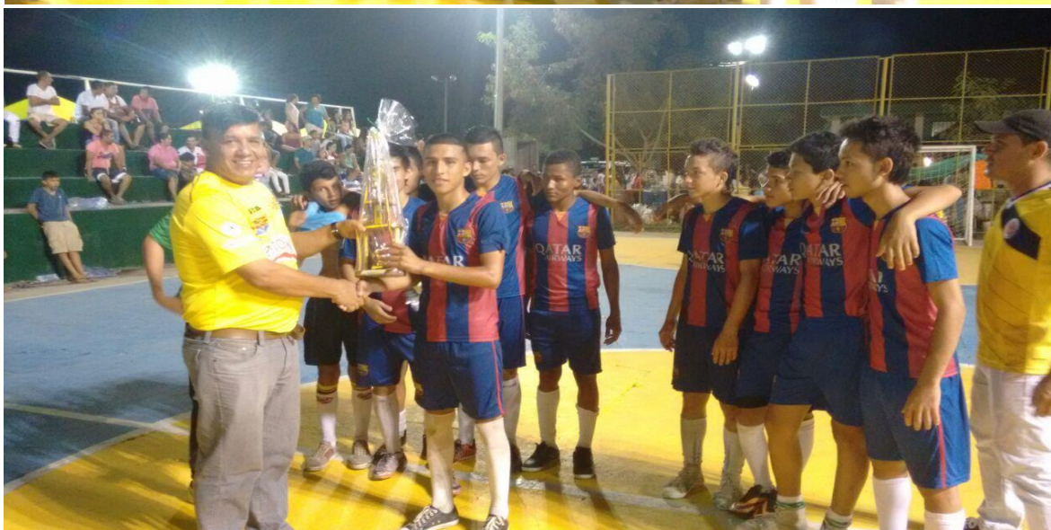
MUNICIPIO DE MARIQUITA CAMPEON DEPARTAMENTAL JUVENIL 2015

Oficina Coliseo Barrio -Rondón Espinal CEL 3118116188 Tolima sub-campeón nacional femenino 2010 San Antonio Tolima campeón nacional sénior máster 2011 Tolima sub-campeón nacional infantil y juvenil 2012 Tolima MEDALLA DE PLATA juegos nacionales 2012 en femenino TOLIMA SEDE XX JUEGOS NACIONALES ESPINAL Y CHAPARRAL SUB-SEDES Tolima CAMPEÓN NACIONAL escuelas de formación 2015