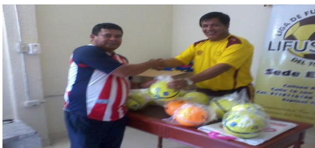
REPRESENTANTE DEL CLUB EL I.T.F.I.P.