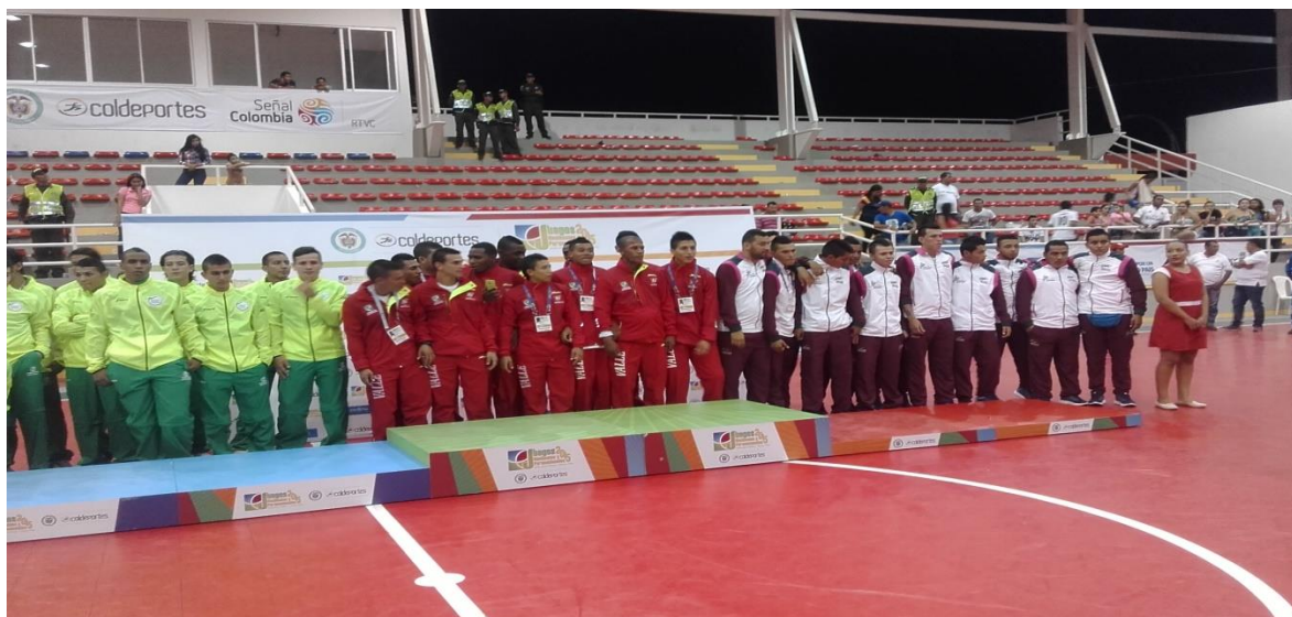
PODIUM JUEGOS NACIONALES 2015 ESPINAL TOLIMA COLISEO LA MAGDALENA