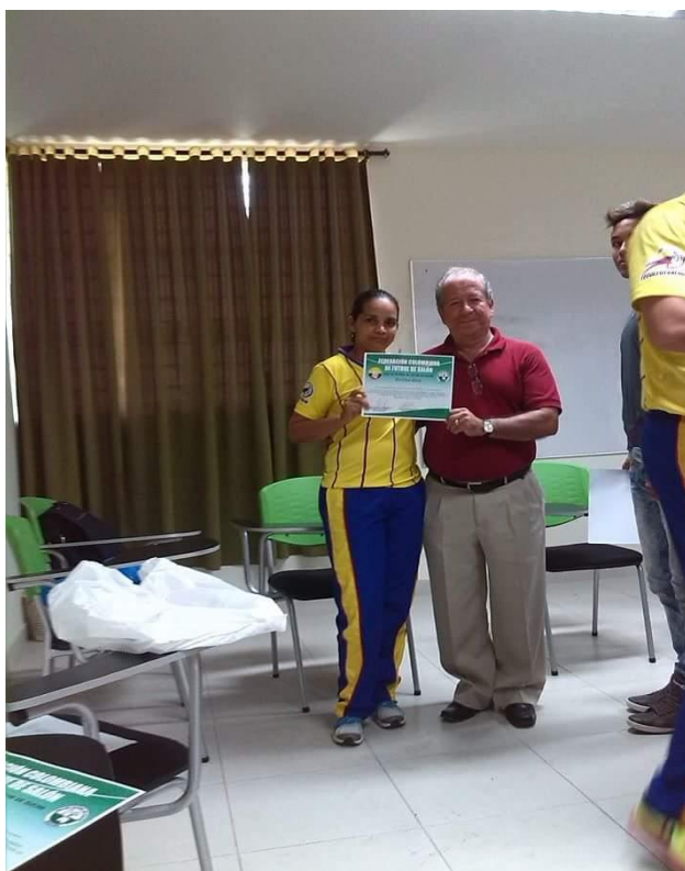
CURSO DEPARTAMENTAL EN SINCELEJO - SUCRE