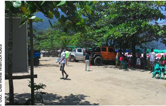
Antes do Estacionamento