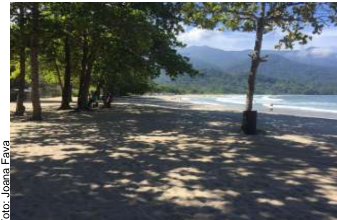
Depois do Estacionamento