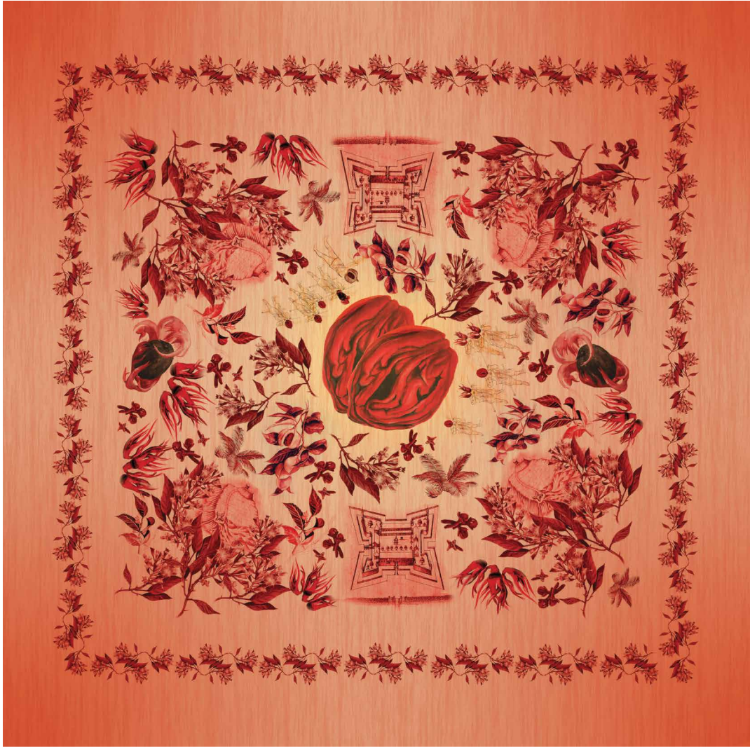
Beatrice Glow, "Banda Island Archipelago", 2016, Digital print on silk, 140 cm x 140 cm