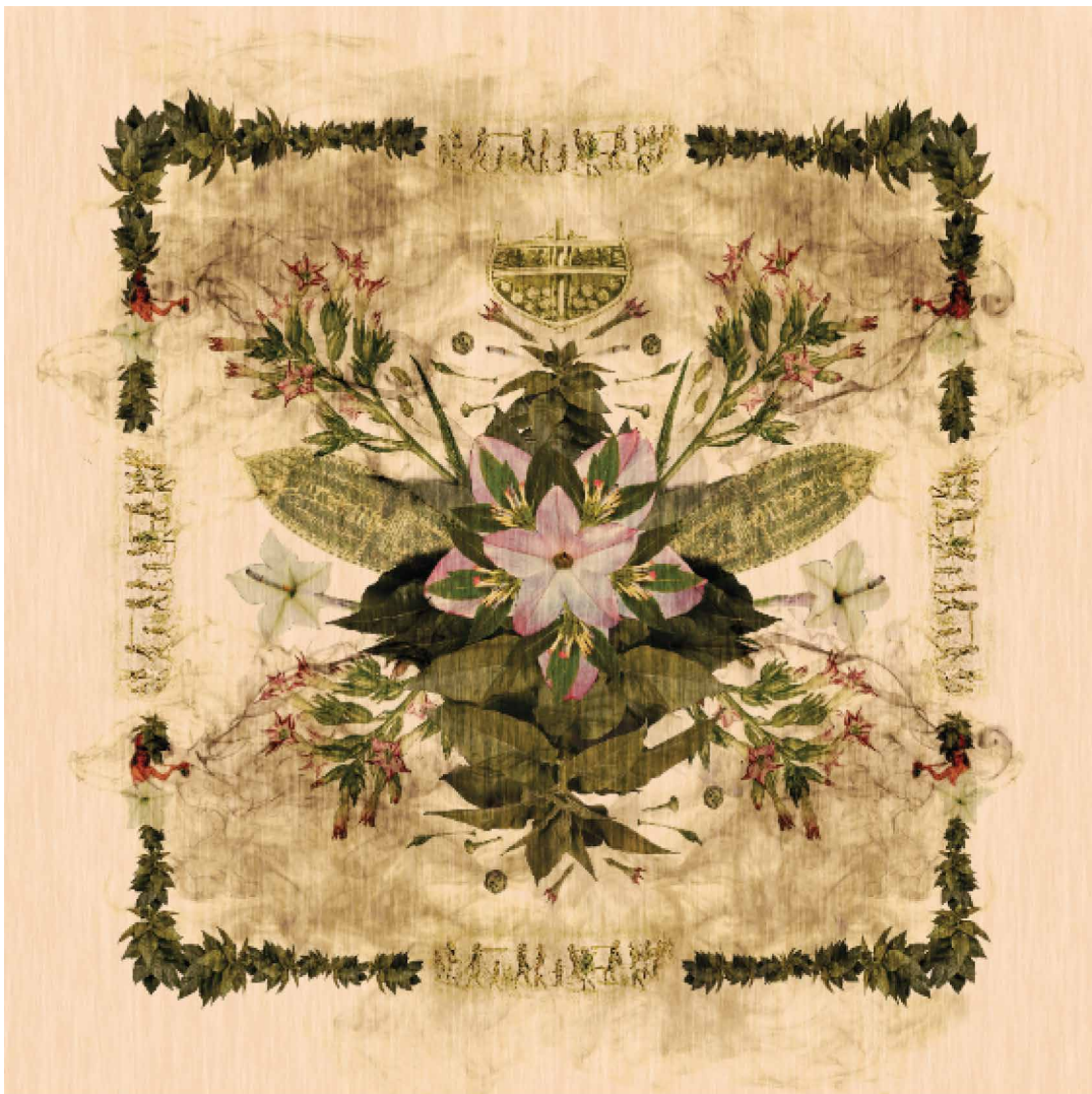
Beatrice Glow "Tobacco", 2016, Digital print on silk, 140cm x 140 cm