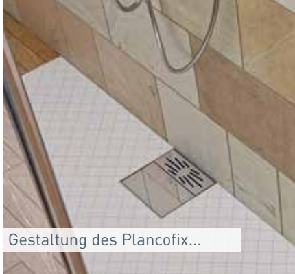
Gestaltung des Plancofix...