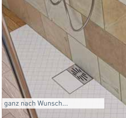
ganz nach Wunsch...