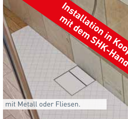
mit Metall oder Fliesen.

Installation in Kooperation mit dem SHK-Handwerk