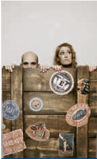
Was, wenn mal keiner klatscht?