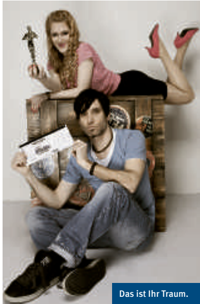
Das ist Ihr Traum.