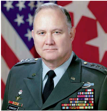
General Norman H. Schwarzkopf (1934–2012).

Die zweite Linie verteidigten die restlichen Garde Div. Darauf entbrannte die grösste Panzerschlacht von «DESERT STORM», die Schlacht um die Medina-Brücke, einen Flussübergang an der irakisch-kuwaitischen Grenze. Nach zwei Stunden erbittertem Panzergefecht waren grosse Teile der Garde Div zerschlagen und die restlichen in den Bereitstellungsraum Basra zurückgeworfen.