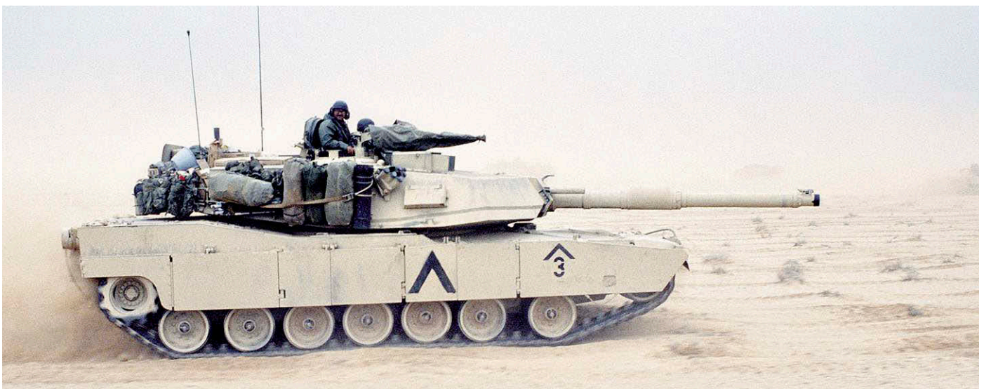
Panzer M1A1 Abrams, VII. Korps, 1. Panzerdivision, Vormarsch Richtung Madinah Ridge.