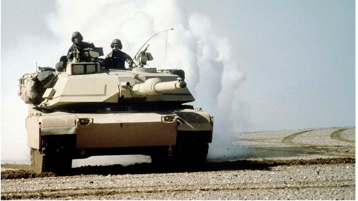
Panzer M1A1 Abrams, VII Korps, 3. Panzerdivision, Vormarsch Richtung Al Bucayyah.

Kuwait selber oder verteidigte die irakische Grenze zu Saudi-Arabien.