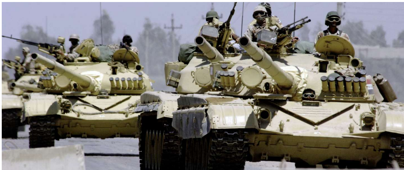
Panzer T-72 Ural, irakische 6. Pz Div «Medina», südlich Nasiriyah, März 2003.

101. Luftlande Div auf die «Medina» Division schlug fehl.