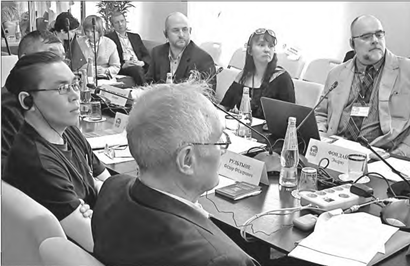
← Тема обсуждения – подсчет количества особей белого медведя чукотско-аляскинской популяции.