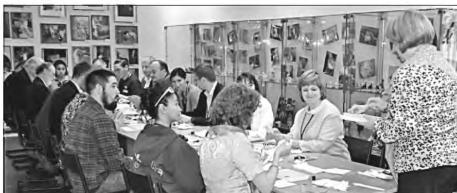
↑ На досуге члены Комиссии побывали в Эгвекинотском краеведческом музее, где для них организовали экскурсию и мастер-класс по изготовлению поделок в национальном стиле.

Особенно понравилась гостям поездка в арке на Полярном круге и в национальное село Амгуэма.