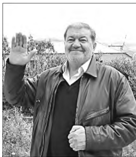
↑ Всем десанникам привет!

– Меня распределили в 105 горно-пустынную дивизию воздушно-десантных войск, где упор делался на подготовку к проведению боевых и тактических операций в азиат-