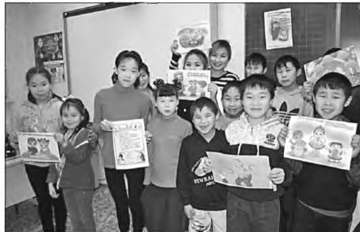
↑ Мероприятие с детьми в селе Рыркайпий.

Оказано содействие в получении различной помощи 30 семьям, находящимся в трудной жизненной ситуации. Кроме того, с целью предотвращения социально опасных ситуаций контролировались семьи категории «группы риска».