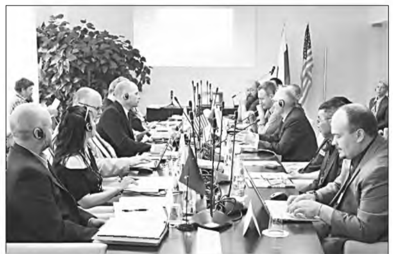
↑ Заседание научной рабочей группы.

Особую тревогу, как отметили в первых же докладах сотрудники научной группы,