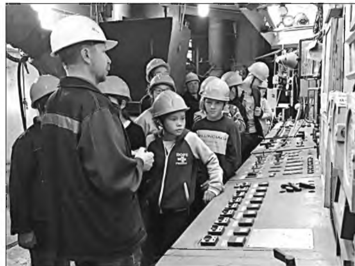
← Школьники младшего звена на экскурсии по Эгвекинской ГРЭС.

Для ребят постарше вопросы оказались серьезнее, викторины сложнее. А уж старшая группа, разбившись на три команды – «Энергетики», «Энергия» и «Шок», – состязалась в КВН-викторине. Ребята представляли свои команды, капитаны команд соревновались в эрудиции, разгадывали кроссворды и ребусы, отвечали на вопросы по истории откры-