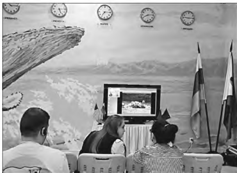
↑ В фойе делегаты, не входящие в состав научной рабочей группы, слушают доклады через прямую трансляцию.

Научной комиссии предстоит решить еще немало вопросов: оценка чукотско-алаянско-аляскинской популяции (разумеется, цифры могут расходиться), вопрос о разрешении на добычу белого медведя, методы мониторинга и прочее.