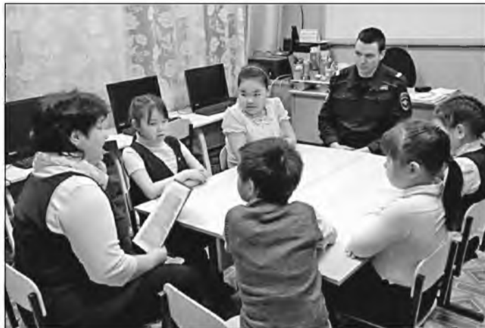
↑ В Ванкареме беседу проводят представители общественной комиссии и органов правопорядка.

ОСНОВНЫЕ ЗАДАЧИ. Это выявление родителей, иных законных представителей несовершеннолетних, не исполняющих своих обязанностей по воспитанию, содержанию несовершеннолетних или отрицательно влияющих на их поведение либо жестоко обращающихся с ними. Предупреждение правонарушений, алко-