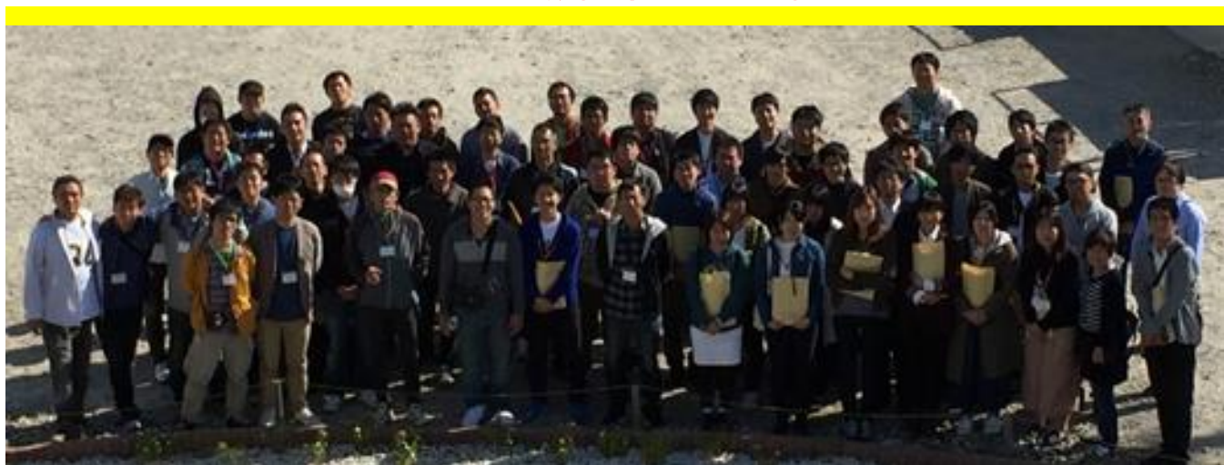
※第 28 回総会記念写真

「わたしはこう思う！」を大切にする青年部活動をみんなで作くり上げ、 一人一人が輝ける生協職場と未来を築こう！！