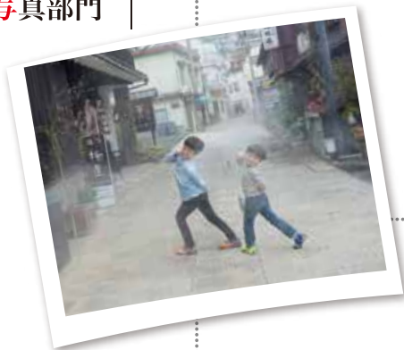
Kannawa Sketching Meeting vol.1