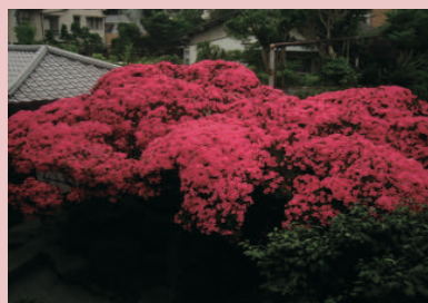
樹齢200年の大木の皐月