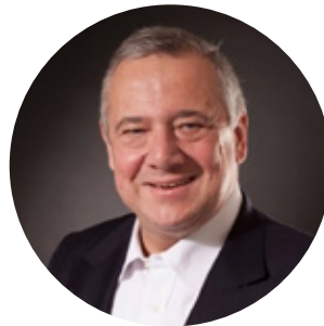
Andreas Dittrich Unternehmens- beratung Finanzen