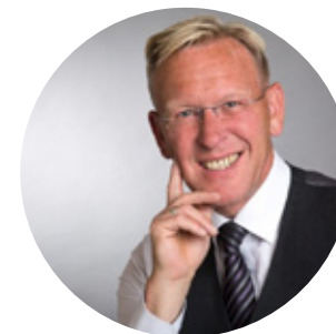
Dirk Rabis PR