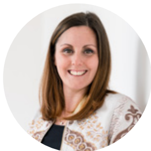
Elisa Hertel Grafikdesign