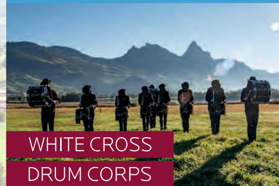
WHITE CROSS DRUM CORPS