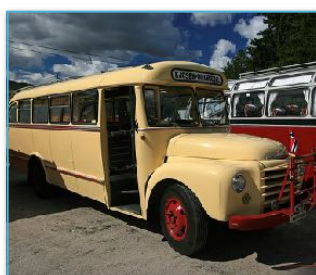
Med veteranbuss til Bryggekapellet