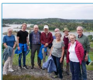
Gamle fjell og Strands historie