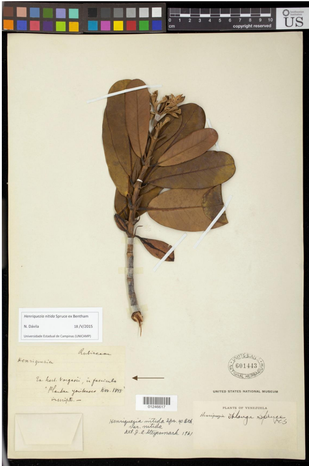
Figura 3. Imagen de una muestra que aquí suponemos fue colectada por Pedro J. Ayres. La flecha indica la etiqueta con la información "Ex herb. vargasii, in fasciculo 'Plantae Yavitenses Nov. 1845' inscripto".