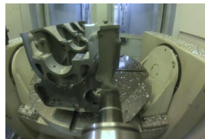
Usinage sur centre 5 axes

Dans le cas de blocs moteurs, nous réalisons à VINT'AIR les opérations d'alésage de la ligne d'arbre. Nous proposons également l'alésage à la cote des coussinets de vilebrequin et de bielle ainsi que de nombreuses prestations sur mesure.