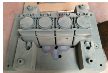
Partie de moule sable imprimée

L'ensemble est ensuite débarrassé du sable non durci, puis « remoulé » (les pièces constituant le moule sont assemblées). Un moule perdu à usage unique est ainsi constitué.