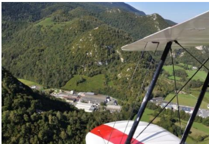
Usine Ventana Arudy (Fonderie)

Grace à une coopération étroite développée avec la société VENTANA , nous proposons désormais une solution globale de fabrication des pièces rares et complexes, particulièrement adaptée aux pièces en fonderie d' alliages légers d'aluminium et de magnésium .